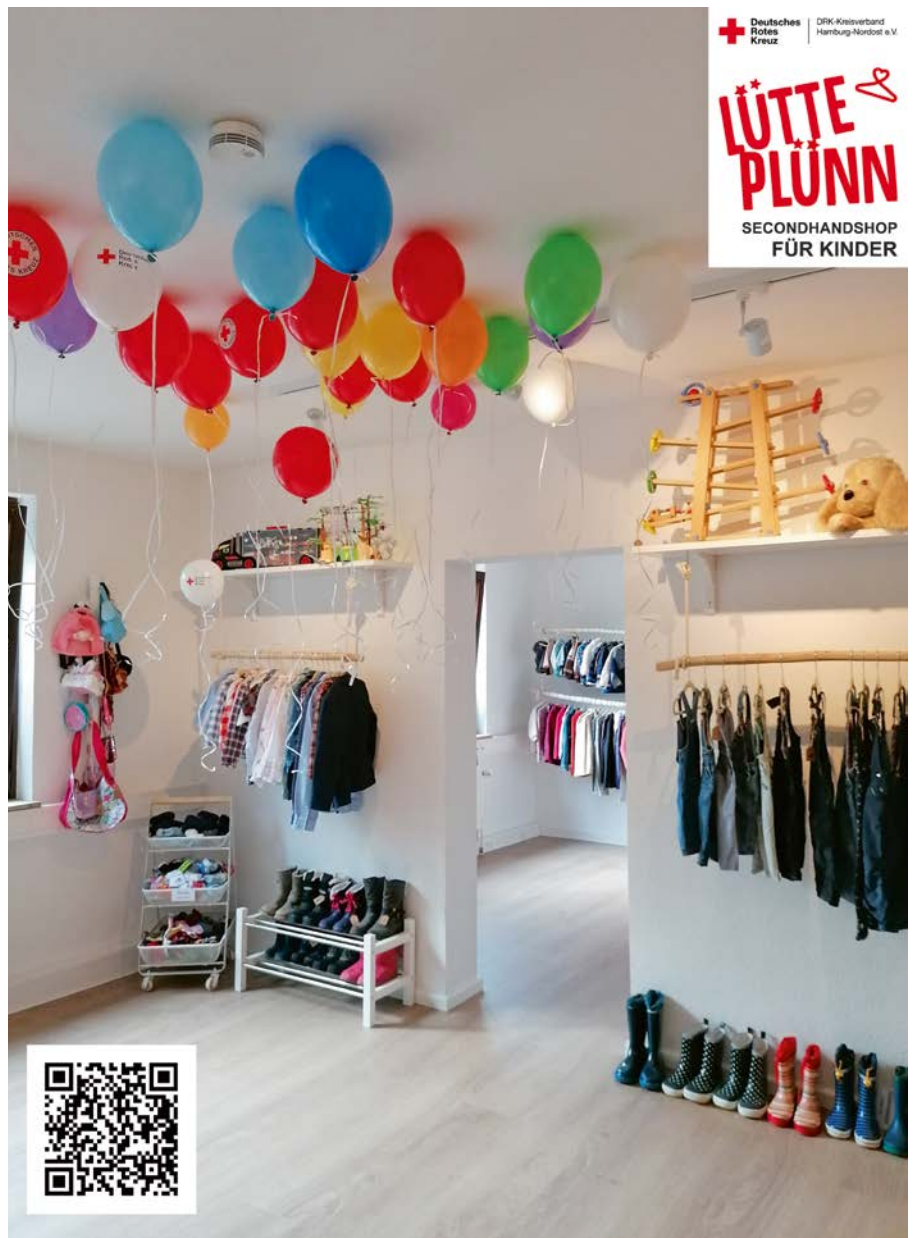
Neueröffnung unseres Secondhandshops für Kinder