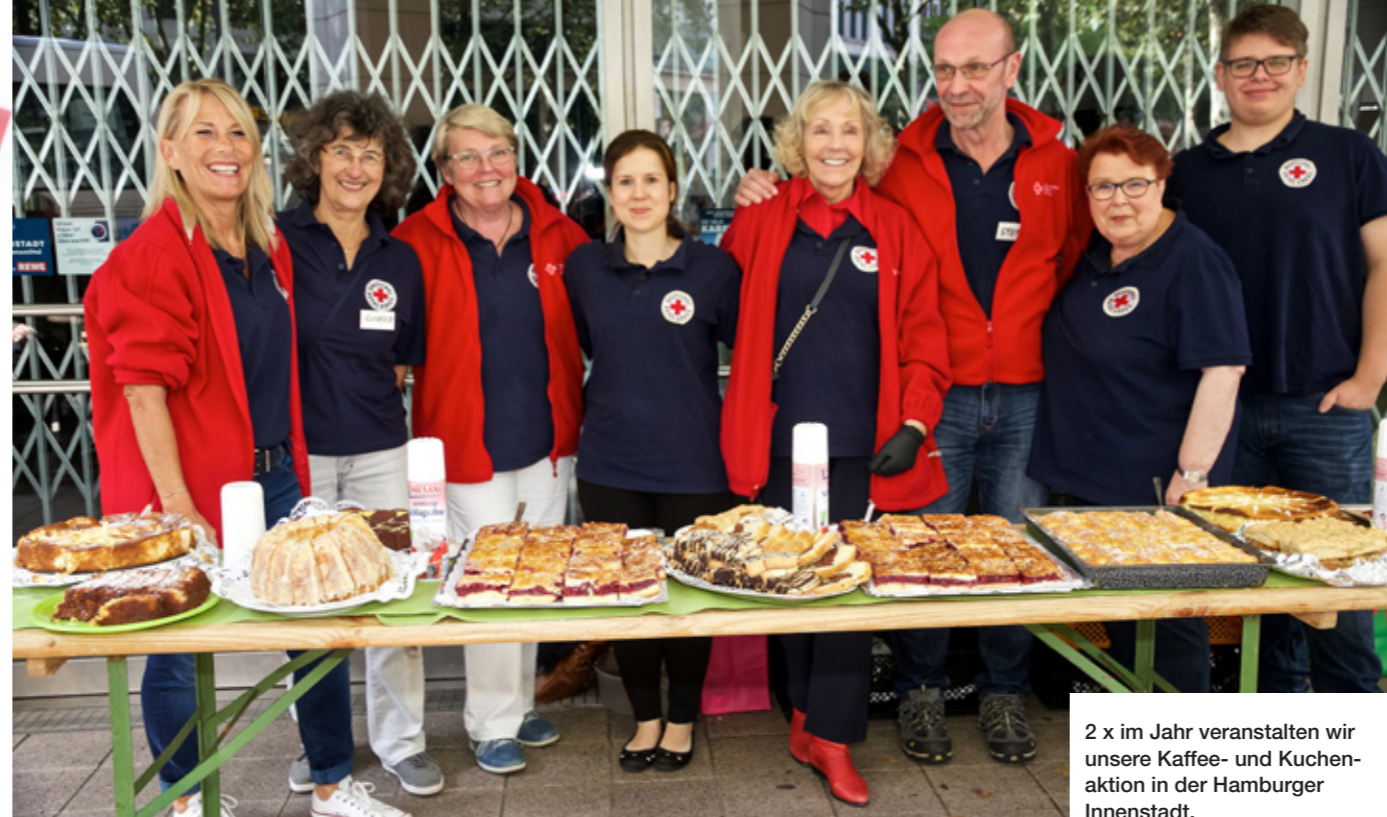
2 x im Jahr veranstalten wir unsere Kaffee- und Kuchenaktion in der Hamburger Innenstadt.

Einladung – 20 Jahre Obdachlosenhilfe! Feiern Sie mit am Sonntag, den 11.11.2018 von 13:00 bis 17:00 Uhr in der Gustav-Adolf-Str. 88 im KV Wandsbek – mit Tombola, Infoständen u. v. m.